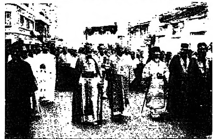
اساتذة زحلة يقدمون المناهج

اجتمع امس في مبنى اقليم بعدا الكتابي عدد من القيادات الطلابية في حزب الكتائب اللبنانية لمناقشة الاوضاع التربوية والطلابية ووضع مصلحة الطلاب الكتابي، وبعد الاجتماع صدر البيان الاتي: ١ - يبدى الطلاب الكتابي حرمهم على انقاذ السنة الدراسية الحالية في ظل ظروف امتية صعبة، ويوجه المجتمعون تحية اكرام الى طلاب المناطق الحرة، الملتزمين بمبادئ القائد الشيخ بشير الجعيل حول ضرورة ممارسة الطلاب لواجباتهم الوطنية من دين ان يؤثر ذلك على انضباطهم ومسلكتهم وتحصيلهم العلمي. ٢ - يستقر المجتمعون ويدينون تدوير مصلحة الطلاب الكتابي بتعيينه المهدي الاعلامي ولا سيما في هذا الظرف من عمر الوطن. ٣ - يرفض المجتمعون ان تجبر المسالك الجامعية النجوية الطلابية والمعلمية في الحزب لمصلحة القوات اللبنانية، وهم يؤكدون على ضرورة الفصل بين الالتزام بالنسالة الكتابية والارتباط بالقطار. وفي الختام اكد الحاضرون على ضرورة تقبل القواعد الطلابية الكتابية وتصويب طريقتها لتعبر دورها الطبيعي المناقشي وتستمر في نضالها العمود في خدمة الوطن.